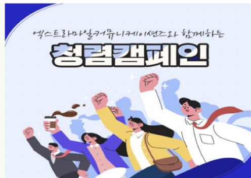
청렴 캠페인(21년 9월)