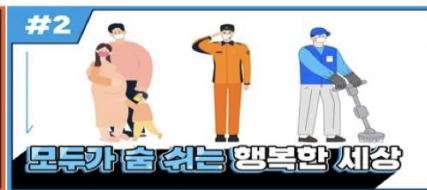
[EMC 웹진 2호] 오투엠