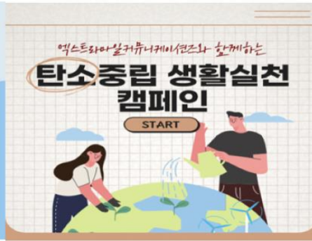
탄소중립 캠페인(21년 11월)