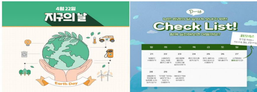
지구의 날 캠페인(21년 4월)