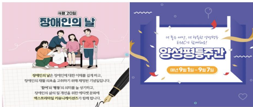
장애인의 날 기념 캠페인(21년 4월)