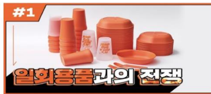
[EMC 웹진 1호] 트래쉬버스터즈