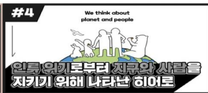
[EMC 웹진 4호] 리하베스트