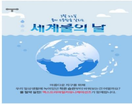
세계 물의 날 캠페인(21년 3월)