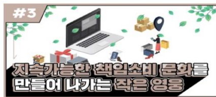
[EMC 웹진 3호] 임팩토리얼